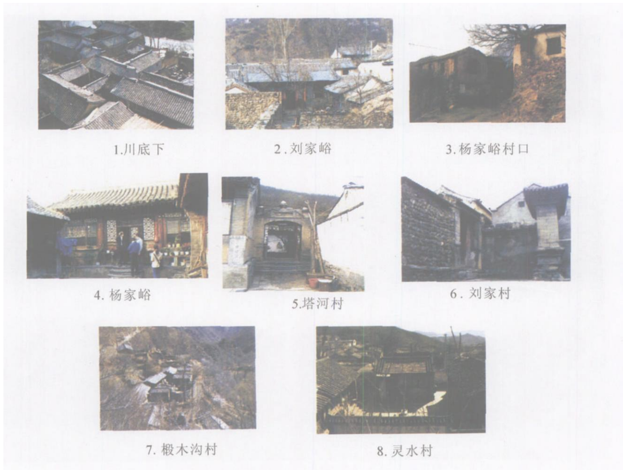
图 1 门头沟传统村落建筑及其景观环境图谱

门头沟传统村落民居以结合山地环境发展起来的山地四合院为主, 既不同与平原, 也不如平原四合院典型, 但山地四合院更具有环境特征, 并形成天人合一的乡土建筑特色和山地居住环境 (图 1)。