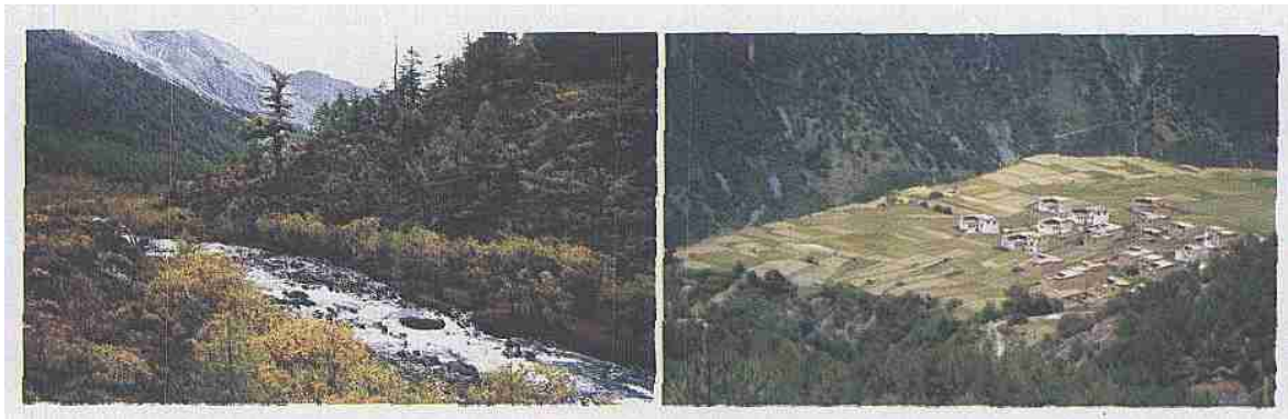
照片 香格里拉自然风光(The nature scene of Shanggrila ecology)

四川香格里拉生态旅游区的生态旅游资源大都保留了未经雕饰的原始风貌, 景观独特、神秘感强, 给人以强烈的对比和新奇的刺激, 如雪峰连绵的贡嘎山、景色瑰奇的海螺沟冰川、气氛神秘且别具一格的甘孜藏传佛教, 以及摩梭女儿国、彝族等百花争艳的万千民族风情。该区生态旅游资源中, 无论是山水风光或是人文胜迹, 都拥有许多奇特度高, 神秘性强、惟我独有的垄断性景观, 成为我省生态旅游资源中的极品(照片)。