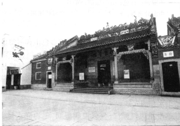
图 2 粤东会馆

百色是继延安和井冈山之后的第三块红色圣地。从 2000 年开始,百色市就开展了以“邓小平足迹之旅”为主线的爱国主义教育旅游活动,以当年左、右江武装起义留下的革命文物和纪念场馆为载体,开辟“红色之旅”旅游产品。几年来,国内外大量游客沿着“邓小平足迹之旅”到革命老区,百色市成为各种形式的爱国主义教育学习考察旅游活动的圣地。例如,粤东会馆(红七军军部旧址),始建于清朝康熙 59 年(1721 年),1929 年邓小平同志成功发动百色起义,就将红七军军部设立于此,见图 2。